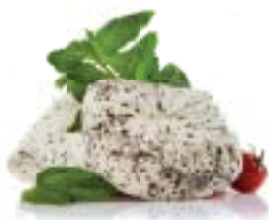
Μικρασιάτικο με δυόσμο