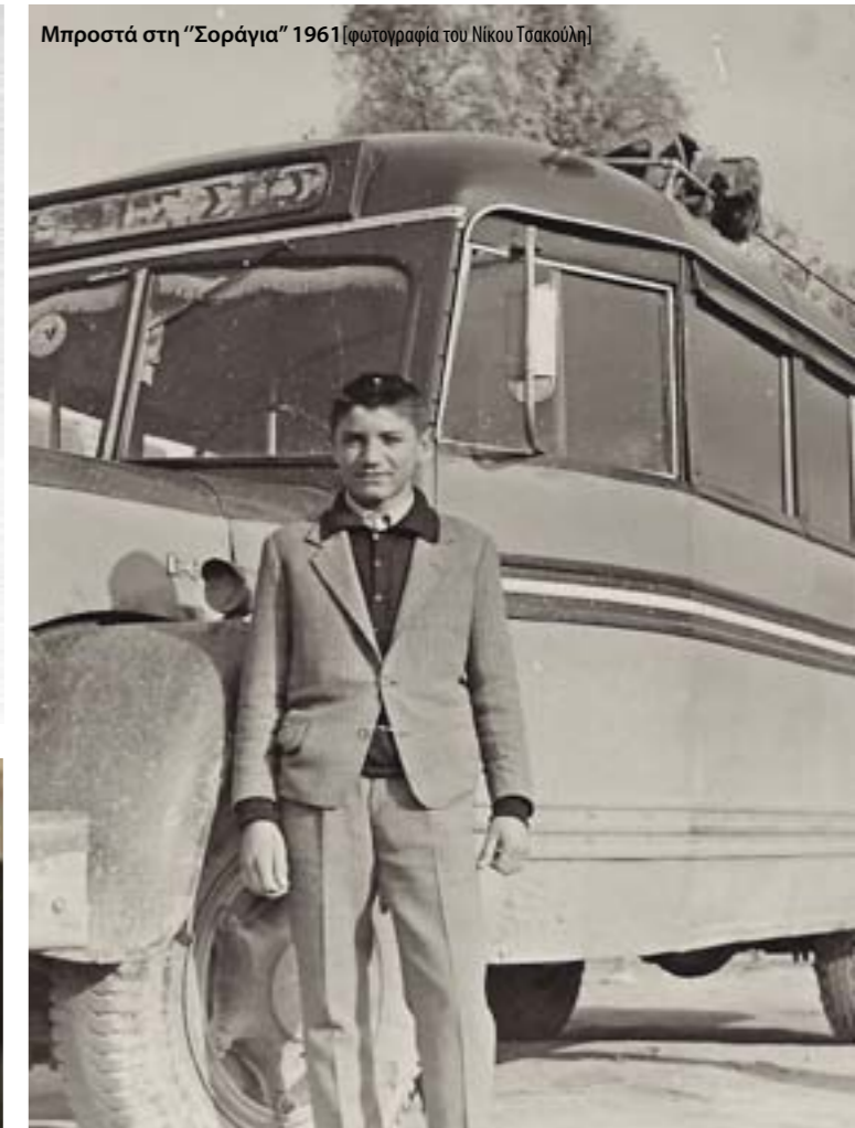
Μπροστά στη "Σοράγια" 1961