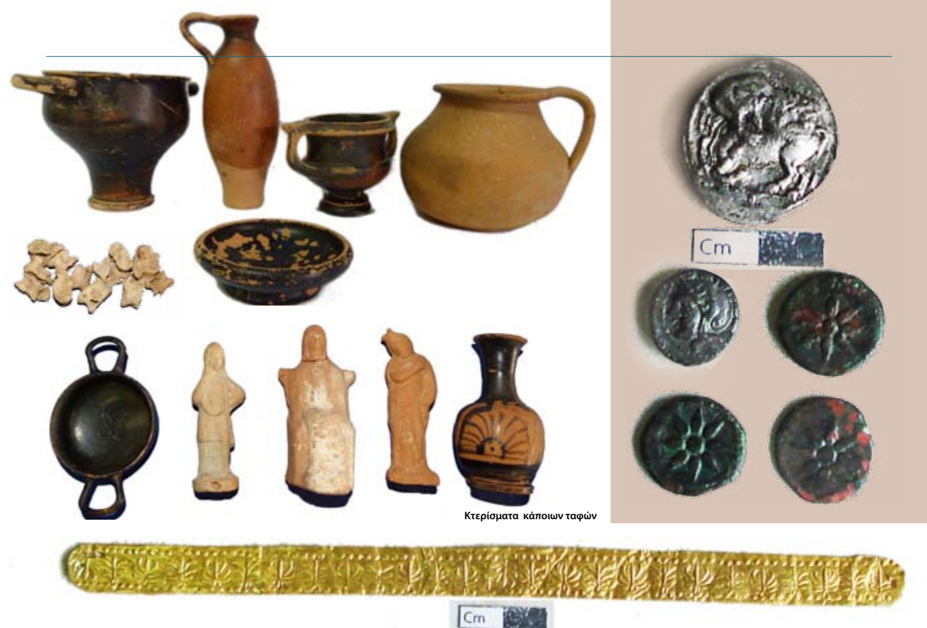
Κτερίσματα κάποιων ταφών

Η έκθεση λειτουργεί σε εργάσιμες ώρες και μέρες, και προς το παρόν η είσοδος είναι ελεύθερη. Αξίζει να σημειωθεί πως κατά τους θερινούς μήνες η επισκεψιμότητα του χώρου είναι μεγάλη και τα σχόλια θετικά, τόσο για το έργο όσο και για τη διατήρησή του. ■