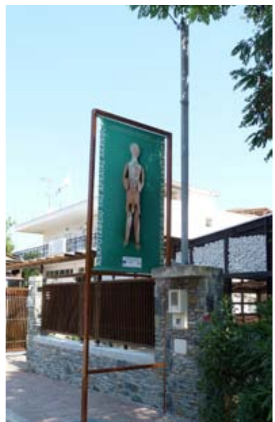
Το έργο εξωτερικά