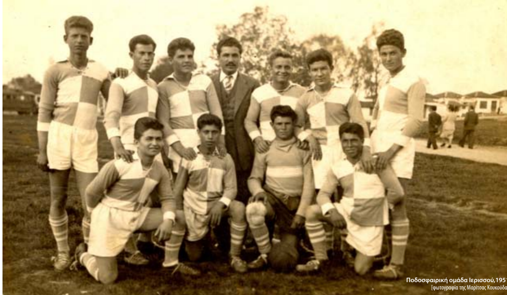
Ποδοσφαιρική ομάδα Ιερισσού, 1951