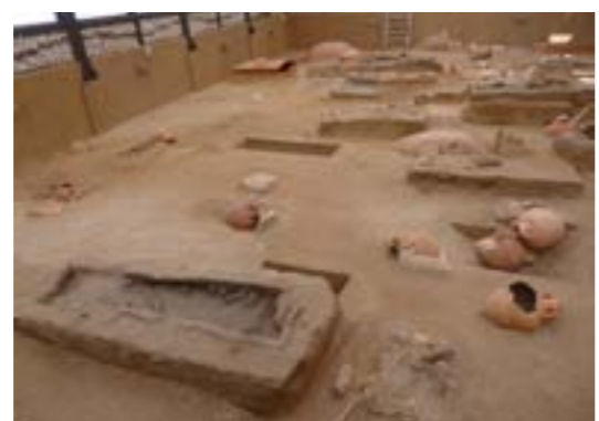
Το εσωτερικό του στεγάστρου