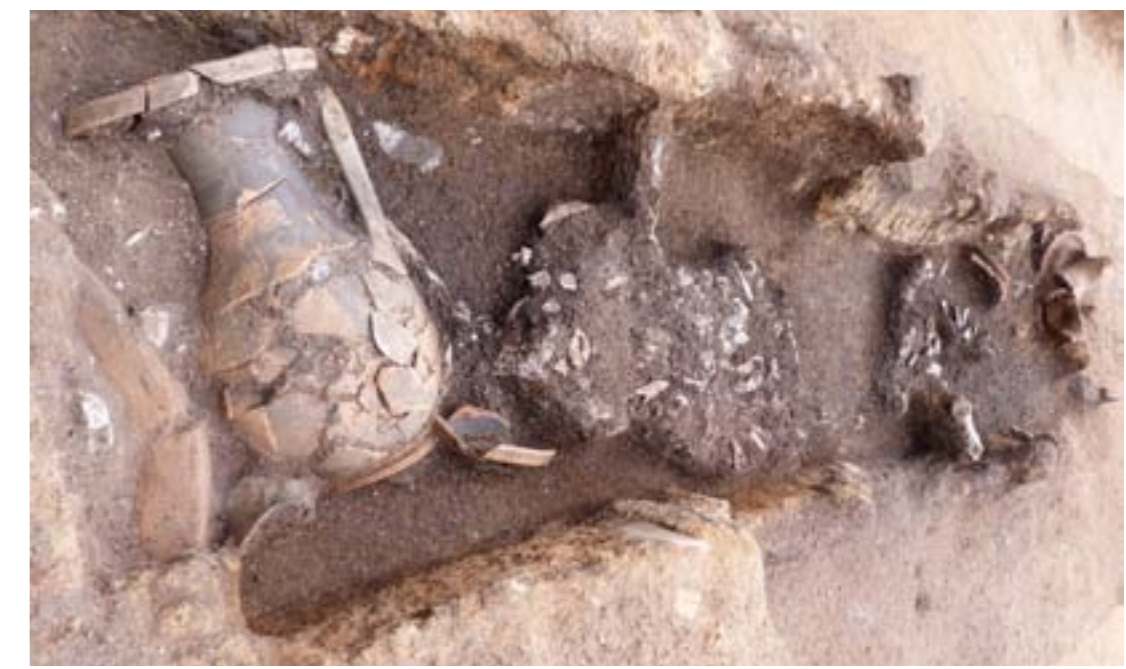
Ταφή με καύση