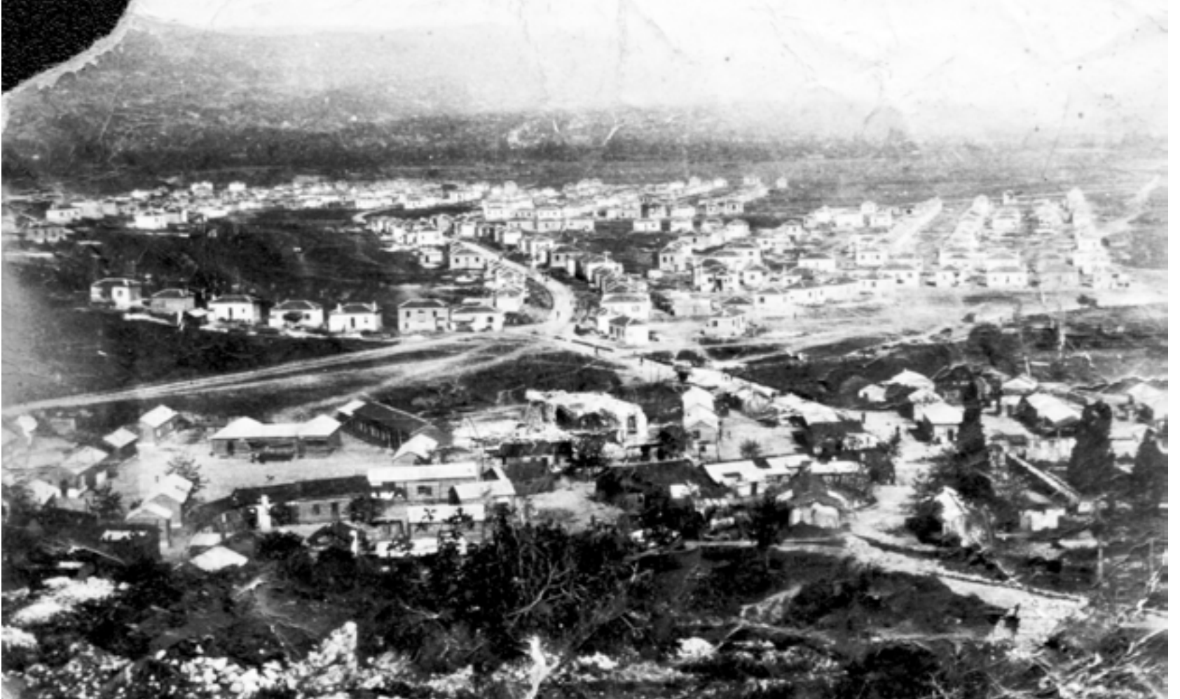
Ιερισσός 1936