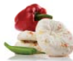
Μικρασιάτικο με καυτερή πιπεριά

“Η φύσις μηδέν μήτε ατελές ποιεῖ μήτε μάτην” Αριστοτέλης, 384-322 π.Χ.