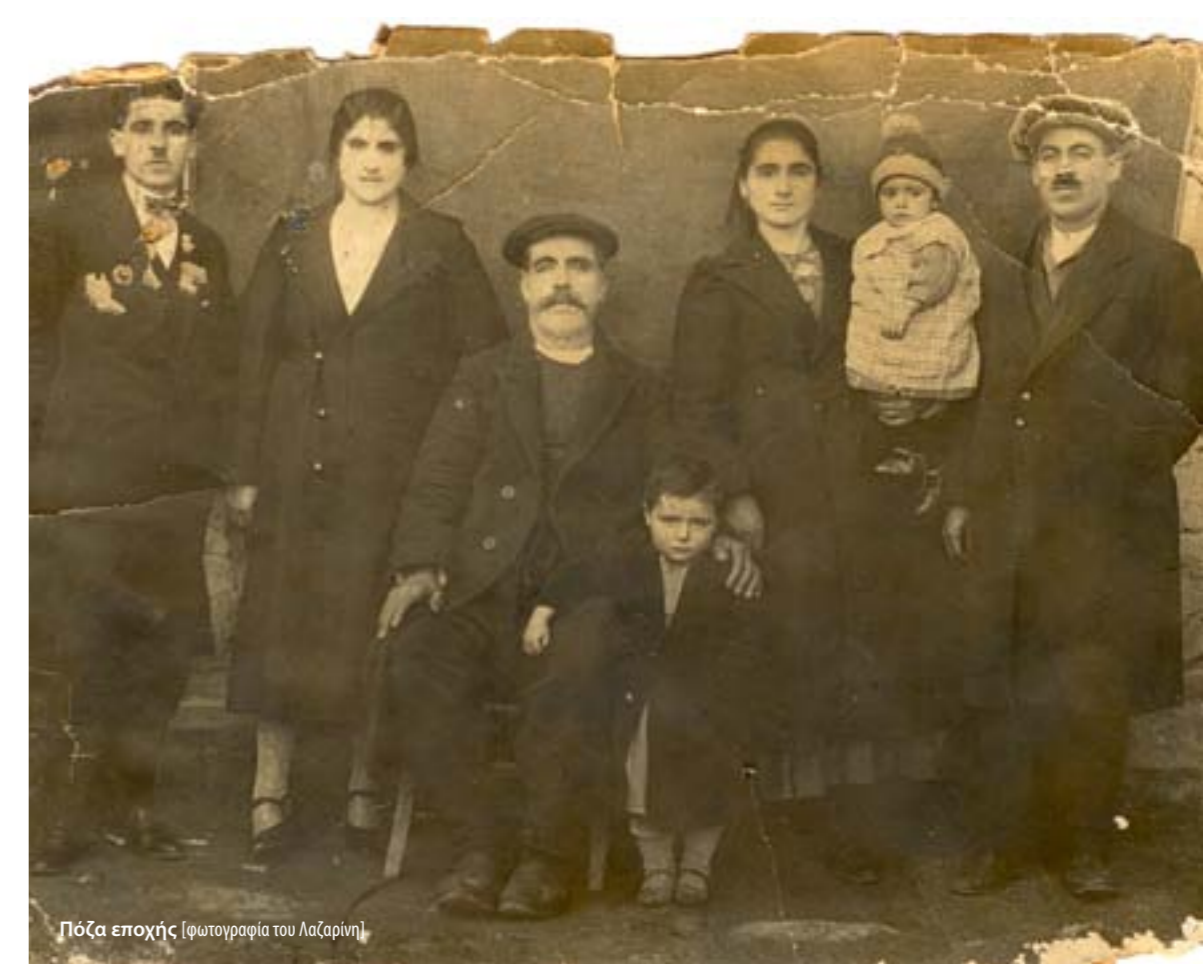
Πόζα εποχής