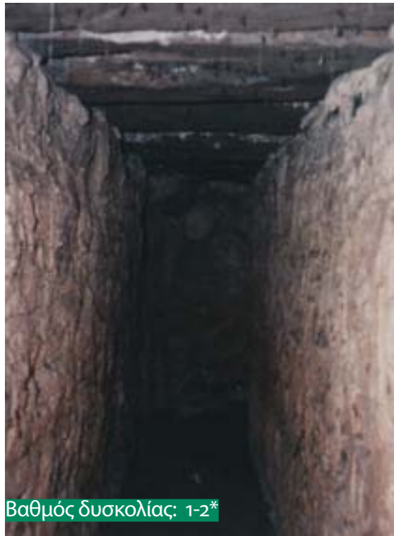
Βαθμός δυσκολίας: 1-2*