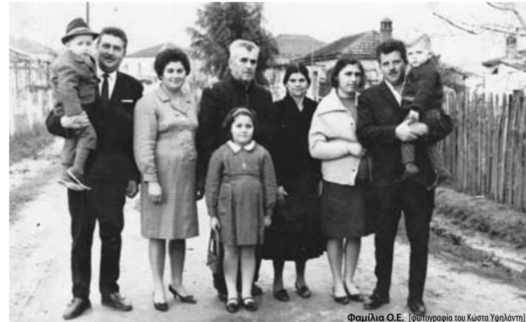
Φαμίλια Ο.Ε.