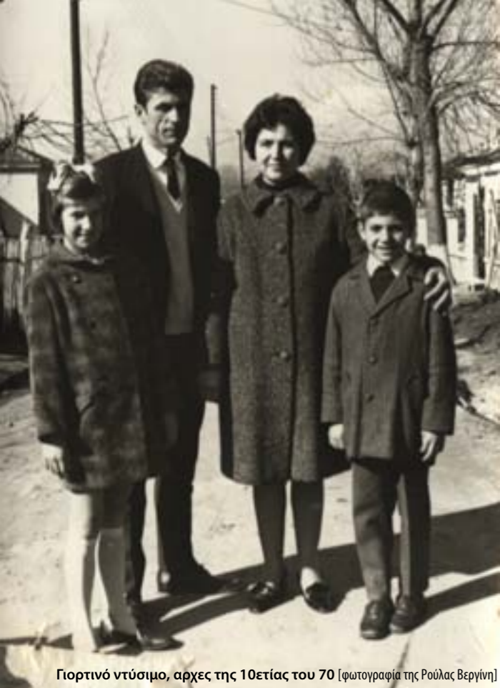
Γορτινό ντύσιμο, αρχές της 10ετίας του 70