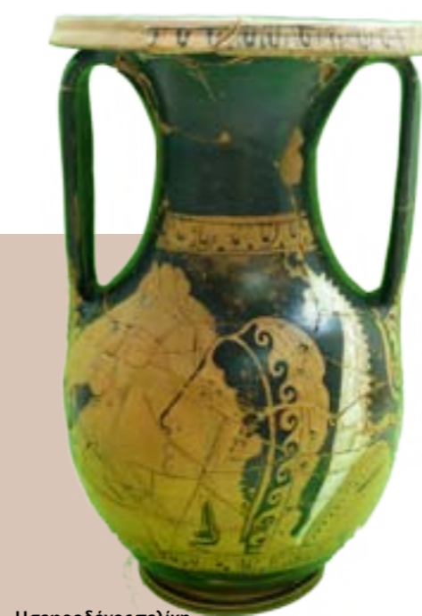
Η τεφροδόχος πελίκη