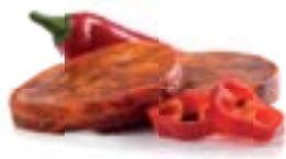
Ελαιoturί με κόκκινο πιπέρι