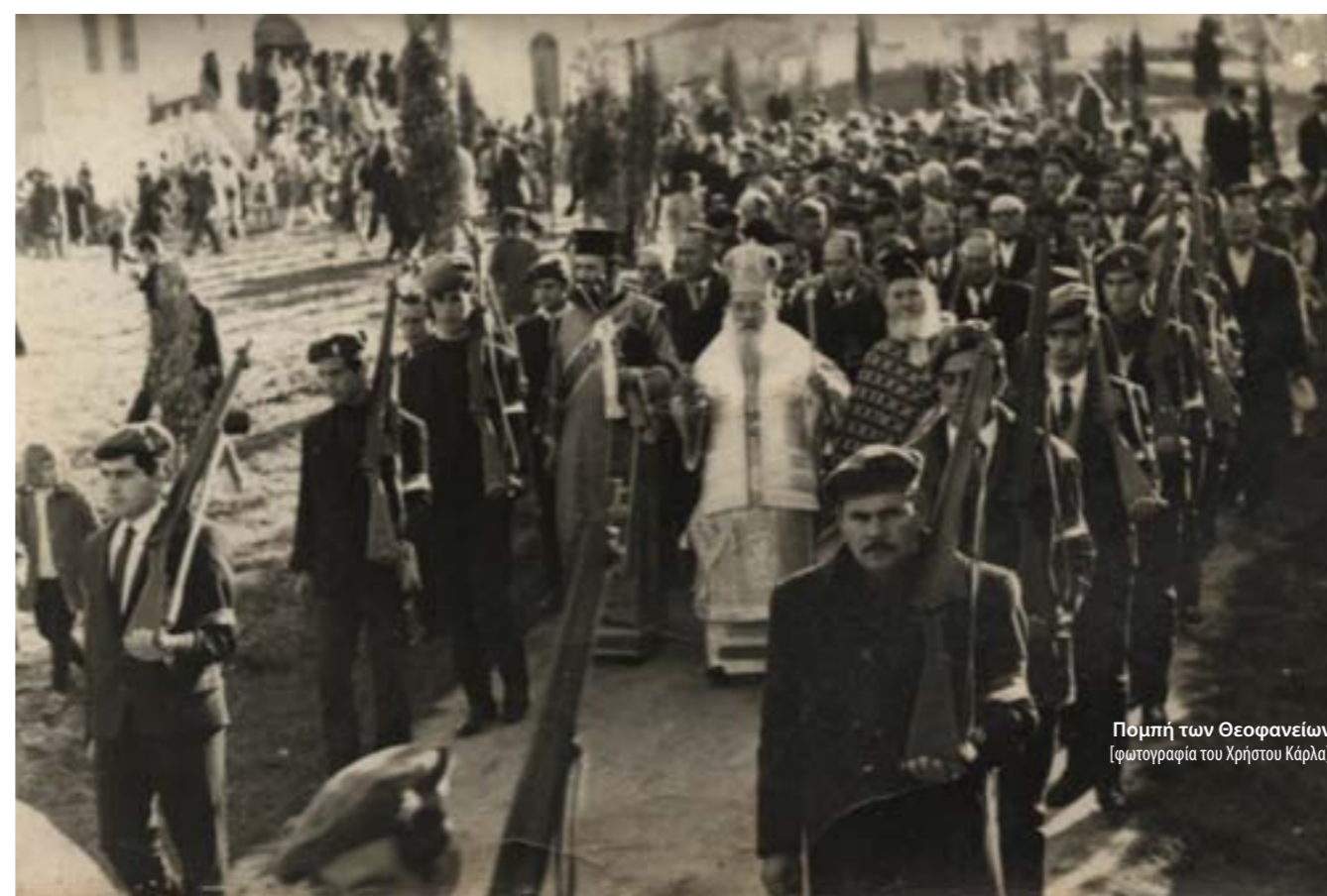
Πομπή των Θεοφανείων