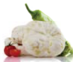
Μικρασιάτικο με πράσινη πιπεριά