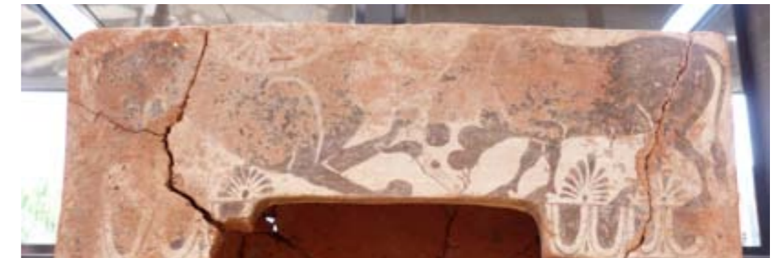
Λεπτομέρεια διακόσμου της σαρκοφάγου