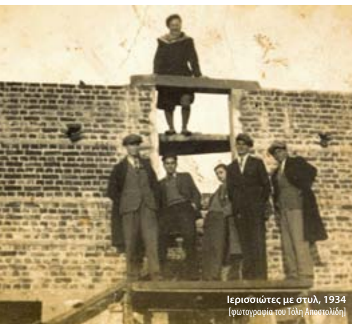
Ιερισσιώτες με στυλ, 1934