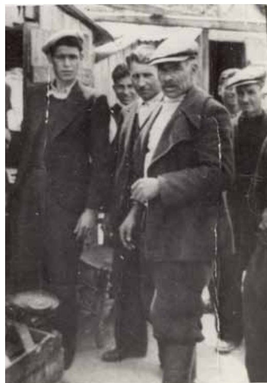
Στην παλιά αγορά της Ιερισσού