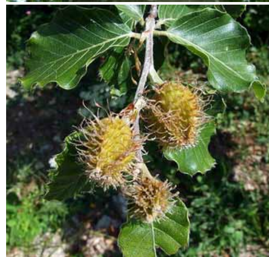
Εικ. 8. Κορμός οξυάς - Εικ. 9. Καρποί οξυάς