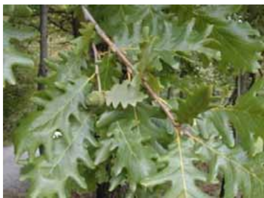
Εικ. 4. Φύλλα δρυός

Δέντρο ύψους 20-25μ και διαμέτρου 1μ. και περισσότερο. Κόμη κυκλική. Μετά από ηλικία περίπου 10 χρόνων σχηματίζει καστανό ξηρόφλοιο, με μικρά στρογγυλά λέπια. Ο καρπός του είναι βελανίδι.