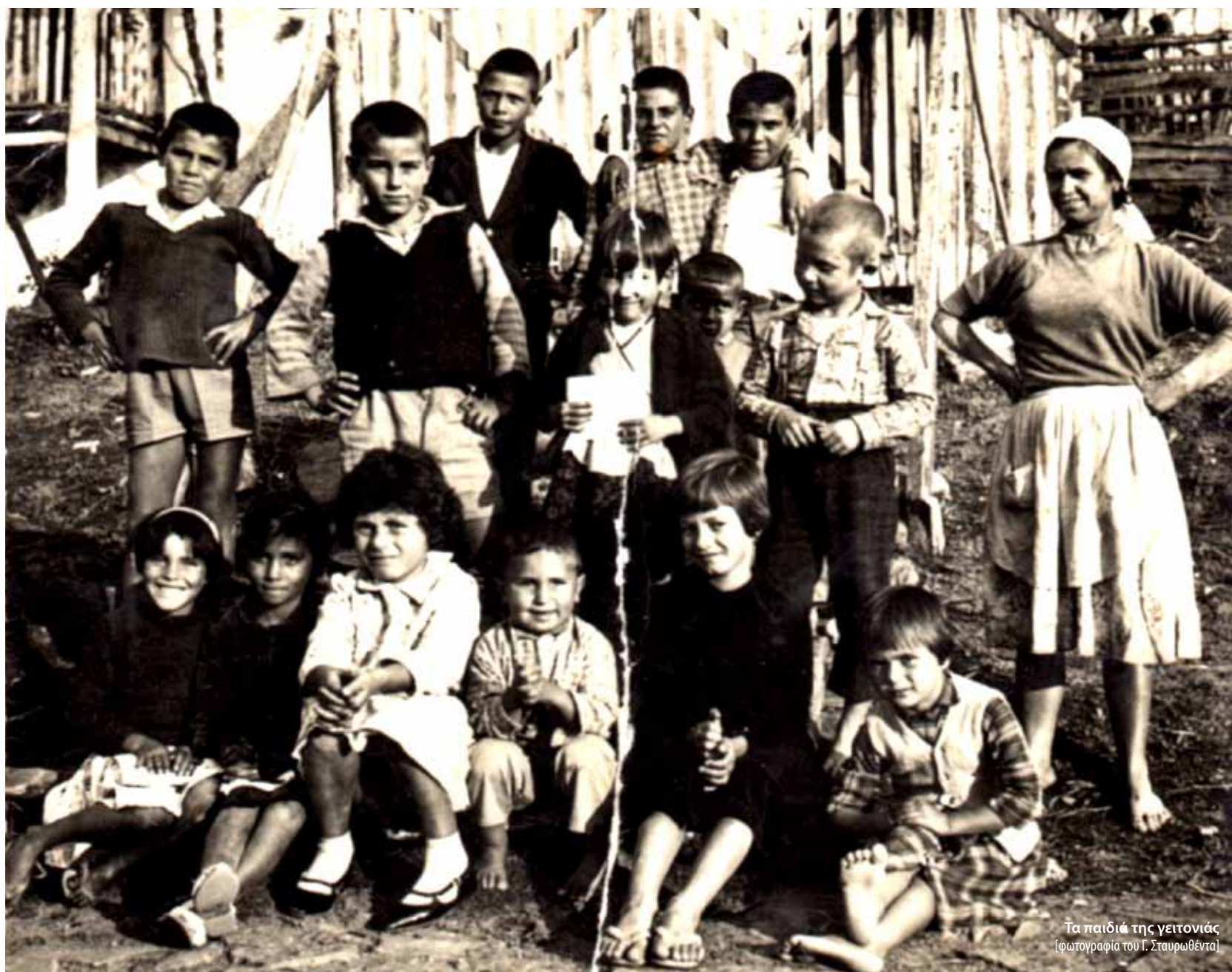
Τα παιδιά της γειτονιάς