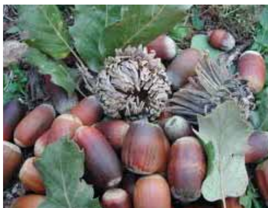
Εικ. 5. Φλοιός δρυός - Εικ. 6. Βελανίδια

Χαρακτηριστικό αυτού του είδους είναι η αργή ανάπτυξη του και η πολύ μεγάλη διάρκεια ζωής του. Αναπτύσσει εκτεταμένο ριζικό σύστημα που εκτείνεται σε μεγάλη έκταση γύρω από το δέντρο και σε μεγάλο βάθος, συμβάλλοντας στην κατακράτηση των εδαφών και στον εμπλουτισμό της υπόγειας υδροφορίας. Λόγω του εκτεταμένου ριζικού συστήματος τα άτομα της βελανιδιάς φύονται σε αραιές αποστάσεις μεταξύ τους, γεγονός που επιτρέπει ενδιάμεσα την ανάπτυξη πολύ πλούσιας θαμνώδους και ποώδους βλάστησης, λόγω των εξαιρετικών συνθηκών και του μικροκλίματος που επικρατεί εκεί. Συνήθως χρειάζεται βαθιά, γόνιμα και νωπά εδάφη.