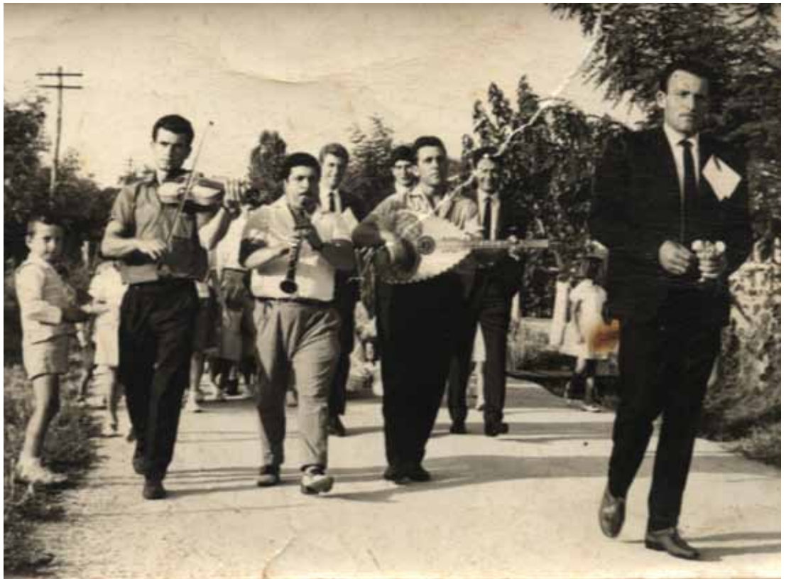
Παραδοσιακός γάμος στην Ιερισσό

Δεν θέλω εγώ κόρη μ' τα μήλα σου, Βάγια, τα τσαλαπατημένα, τα δυο σου μήλα, Βάγια, θέλω εγώ τα μωσοχυρισμένα.