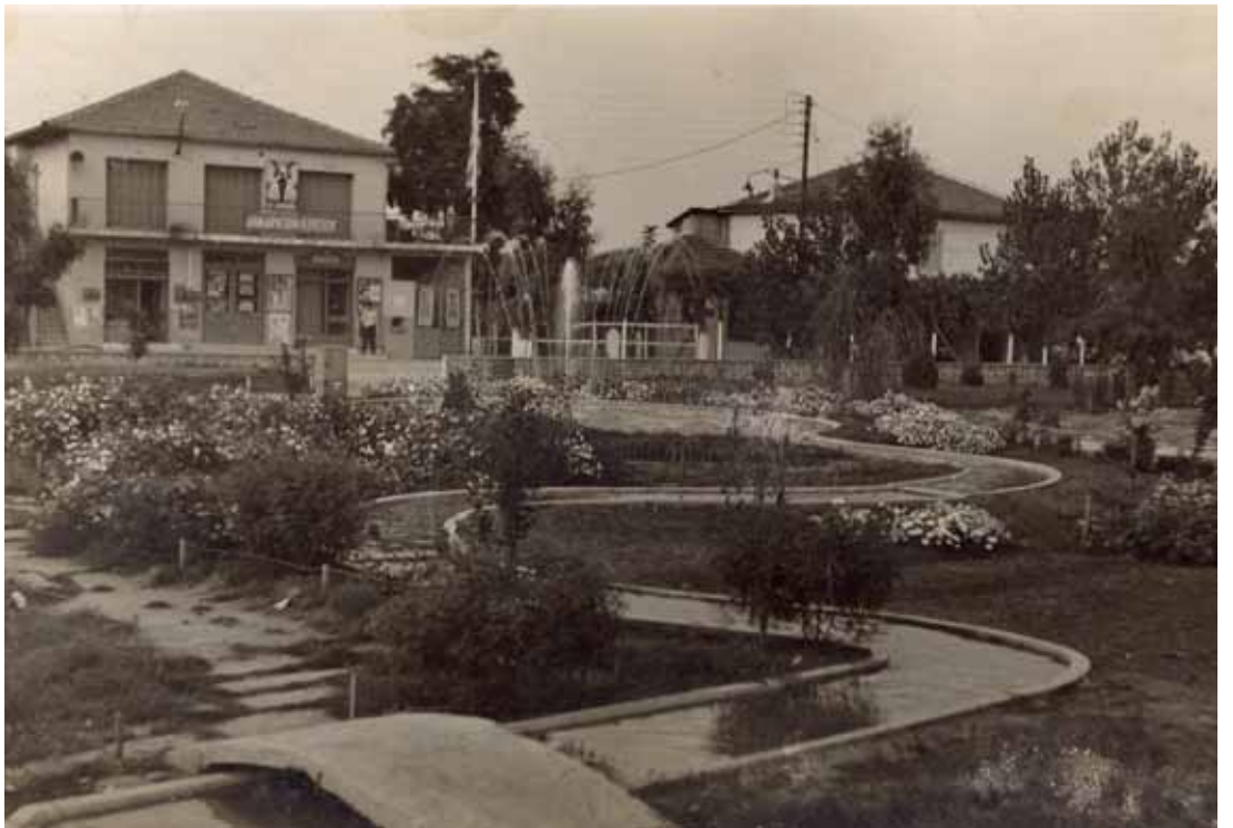
1971, το πάρκο της Ιερισσού, το Δημαρχείο στον πρώτο όροφο και στο ισόγειο ο κινηματογράφος.

Πολύ αργότερα, εκεί γύρω στο '90 με '95, ένα θερινό σινεμά άνοιξε τις πόρτες του για κάποια χρόνια, κοντά στην παραλία της Ιερισσού. Δυστυχώς και ο βίος αυτής της όμορφης προσπάθειας ήταν μικρός, καθώς διάφορες δυσκολίες εμπόδισαν τη συνέχεια της λειτουργίας του. Έτσι και πάλι αυτός ο εναλλακτικός τρόπος διασκέδασης σταμάτησε να υπάρχει.