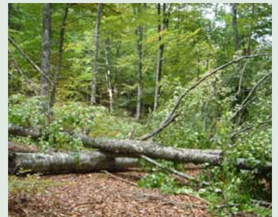
Εικ. 2 Λαθροϋλοτομία δρυός - Εικ. 3 Λαθροϋλοτομία οξιάς

Τα δασικά είδη που υλοτομούνται στην περιοχή μας και προορίζονται κυρίως για καυσόξυλα είναι τα 2 είδη παρακάτω: