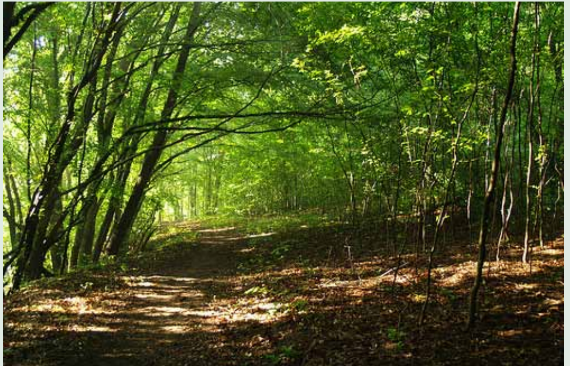
Εικ.1. Δάσος της περιοχής μας απaráμιλλης ομορφιάς

Γενικά το δάσος είναι πλουτοπαραγωγική πηγή και η επιστημονική διαχείρισή του περιλαμβάνει την απολαβή ξύλου και άλλων προϊόντων για την εξυπηρέτηση των αναγκών του ανθρώπου. Η διαχείρισή τους όμως πρέπει να γίνεται με το πνεύμα της <<αειφορίας>>, δηλαδή με τρόπο που να μπορεί να εγγυηθεί την αιώνια διατήρηση των δασών και να υπάρχουν πάντα οι παραπάνω ωφέλειες.