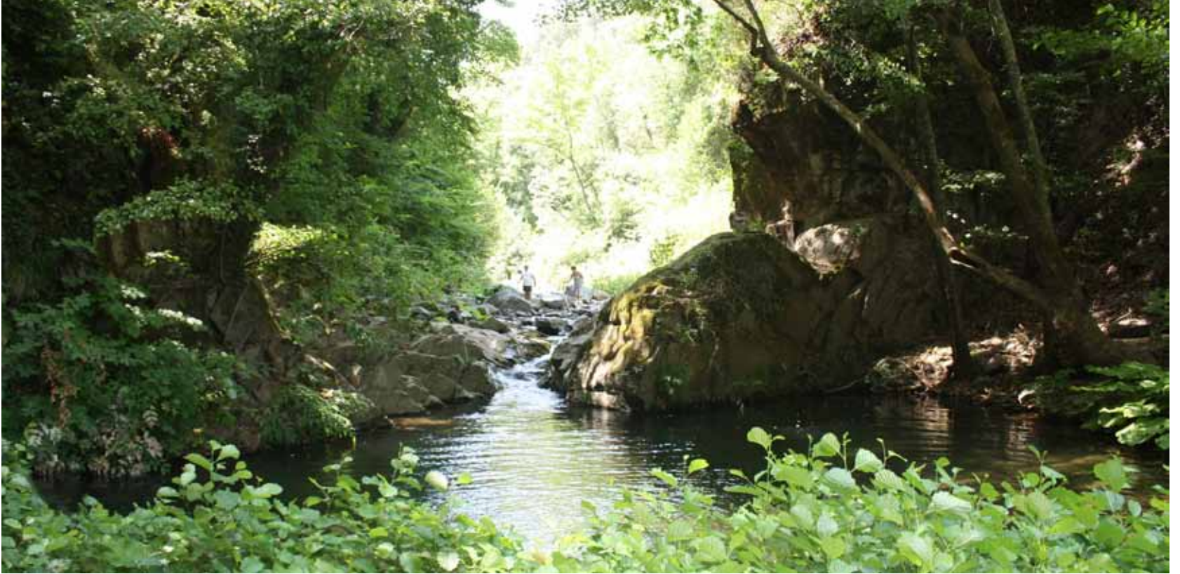
Κάκκαβος. Βάθρα στον Καρόλακα.