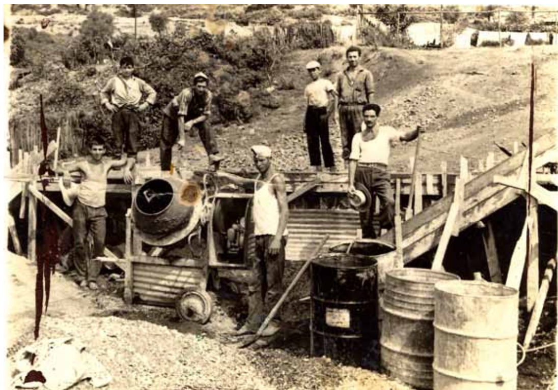
Η δουλειά κάνει τους άντρες