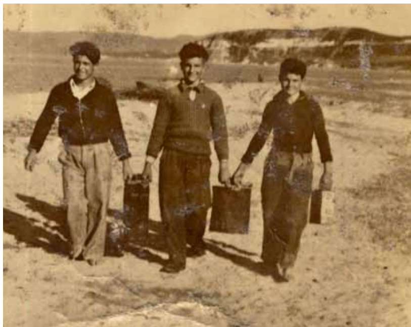
1960, πετρέλαιο με τον τενεκέ για το καΐκι