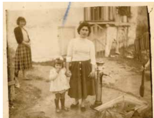
Βρύση στην πάνω γειτονιά