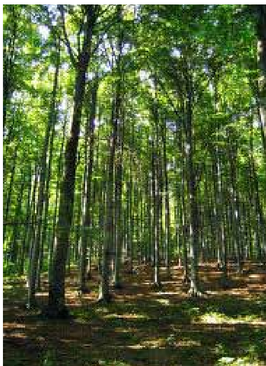
Εικ. 7. Δάσος οξυάς

Χαρακτηριστικό αυτού του είδους είναι η αργή ανάπτυξη του και η πολύ μεγάλη διάρκεια ζωής του. Αναπτύσσει εκτεταμένο ριζικό σύστημα που εκτείνεται σε μεγάλη έκταση γύρω από το δέντρο και σε μεγάλο βάθος, συμβάλλοντας στην κατακράτηση των εδαφών και στον εμπλουτισμό της υπόγειας υδροφορίας. Λόγω του εκτεταμένου ριζικού συστήματος τα άτομα της βελανιδιάς φύονται σε αραιές αποστάσεις μεταξύ τους, γεγονός που επιτρέπει ενδιάμεσα την ανάπτυξη πολύ πλούσιας θαμνώδους και ποώδους βλάστησης, λόγω των εξαιρετικών συνθηκών και του μικροκλίματος που επικρατεί εκεί. Συνήθως χρειάζεται βαθιά, γόνιμα και νωπά εδάφη.