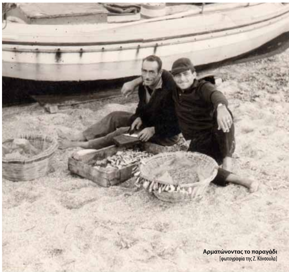
Αρματώνοντας το παραγάδι