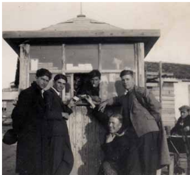
Το περίπτερο στην παλιά αγορά