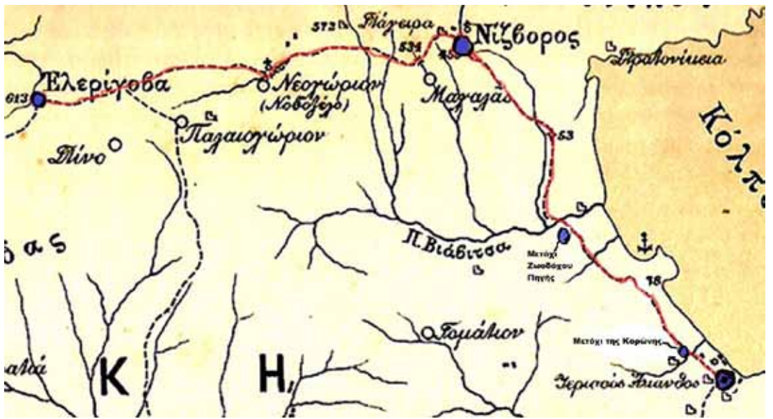
Η διαδρομή του περιηγητή πάνω σε απόσπασμα από χάρτη της Χαλκιδικής του 1898 του περιηγητή Λαζαρίδη.

Η σύζυγος του νεαρού, του αδερφού της δολοφόνου, σοκαρίστηκε τόσο πολύ από το νέο που αρρώστησε και πέθανε μέσα σε λίγες ημέρες. Παρ' όλα αυτά ο σύζυγος δεν φορούσε ένδειξη πένθους και ούτε έδειχνε, όπως είπα, σημάδια λύπης.