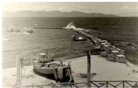
Το λιμάνι της Ιερισσού... παλιά!

Αργότερα και πριν την επιστροφή επισκεπτόμασταν το γειτονικό εκκλησάκι του Αϊ - Νικόλα και ανάβαμε πού και πού ένα κεράκι... Κάποιες άλλες φορές πάλι περνούσαμε και από το καινούριο ξενοδοχείο, τριγυρνούσαμε στις τεράστιες βεράντες του και κάναμε όνειρα ότι μπορεί κάποτε να γινόμασταν πελάτες του... Σιγά-σιγά όμως και καθώς ο καιρός περνούσε, το λιμανάκι μας άρχισε