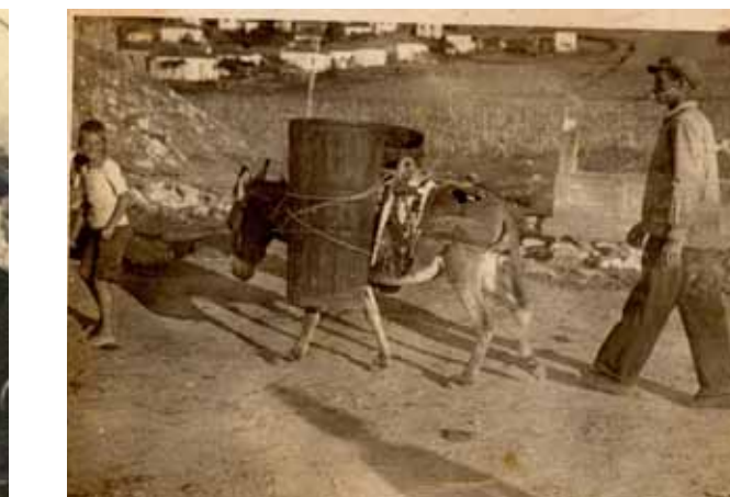
Όνος και Οίνος