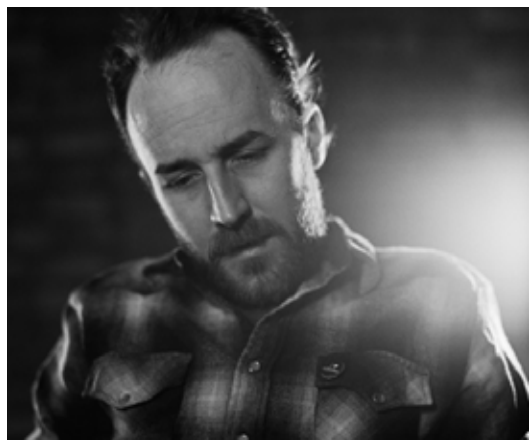
Ο Derek Cianfrance

Η εικόνα της αποδόμησης της σχέσης ενός ζευγαριού, όχι και τόσο μεγάλο σε ηλικία, που φτάνει στο τέρμα και αναπόφευκτα χωρίζει, μας είναι τόσο γνώριμη, αν όχι απο την δική μας εμπειρία, σίγουρα απο κάποιον κοντινού μας πρόσωπου!