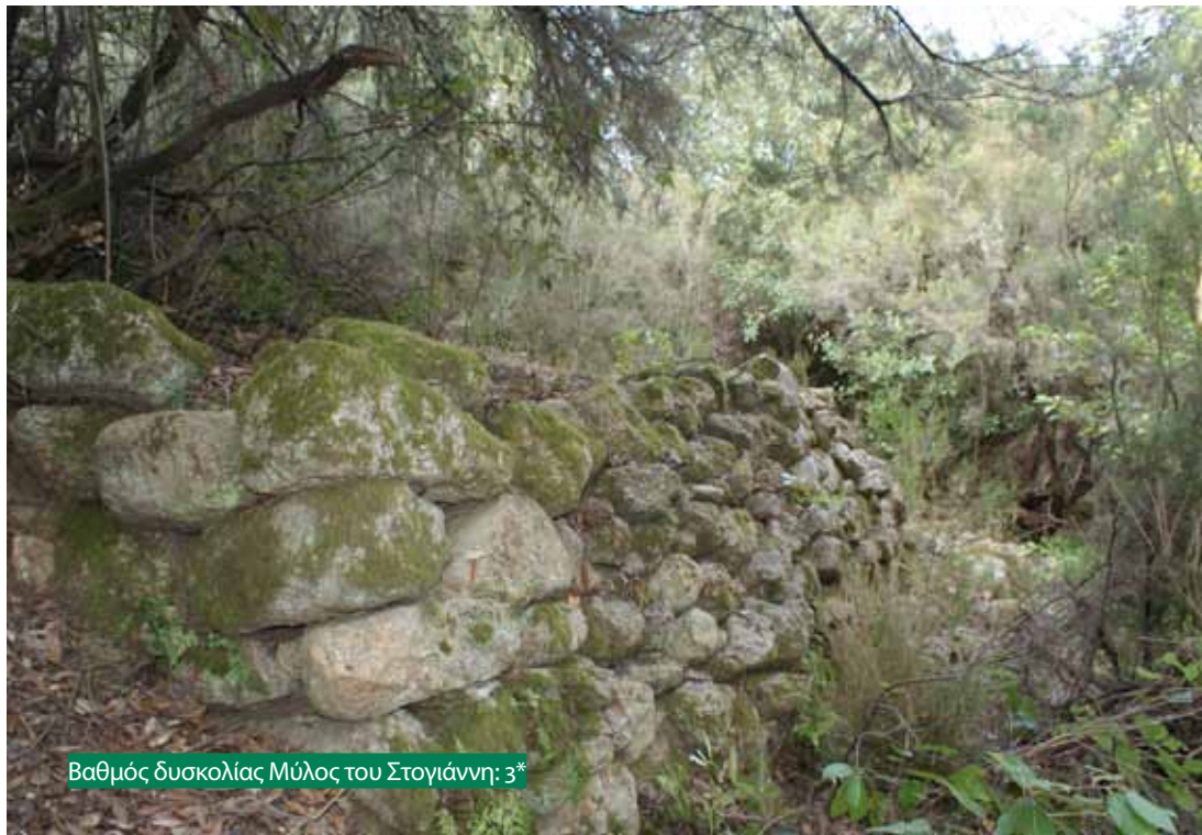
Βαθμός δυσκολίας Μύλος του Στογιάννη: 3*