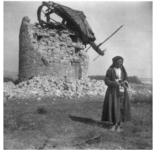
Τα απομεινάρια του ανεμόμυλου του Πάππα μετά τον σεισμό του 1932.

Ο τόπος που ζούμε έχει πολλές φυσικές ομορφιές. Αρκετές από αυτές βρίσκονται σε τοποθεσίες που δυστυχώς για διάφορους λόγους δεν είναι ευρέως γνωστές. Από αυτή την στήλη θα προσπαθήσουμε να σας τις γνωρίσουμε έτσι ώστε αν θελήσετε να μπορέσετε να τις επισκεφθείτε.