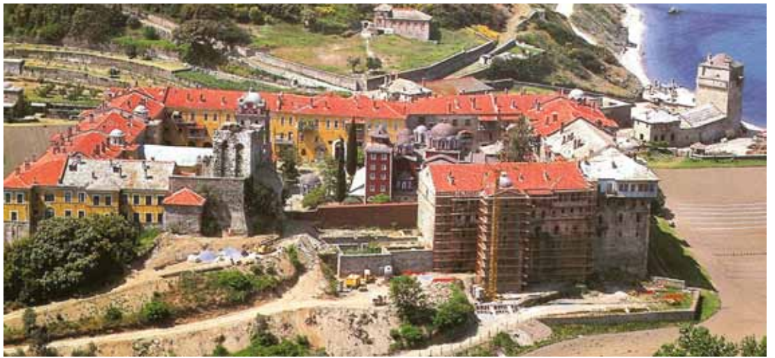
Η Ιερά Μονή Ίβήρων [Αεροφωτογραφία]

6 Προφανώς ή Μονή ταυτόχρονα έστειλε τό Τηλεγράφημα και στον Μητροπολίτη Θεσσαλονίκης, επειδή ή έπισκοπή Ίερισσού και Άγίου Όρους ύπαγόταν σ' αυτόν και προφανώς ό Μητροπολίτης Θεσσαλονίκης μαζί με τήν έννημερωτική Έπιστολή προς τόν Ίερισσού, ή όποια δέν ύπάρχει ούτε στο Αρχείο της Μητροπόλεως Ίερισσού, ούτε στο Αρχείο της Δ. Ί. Συνόδου, έστειλε σ' αυτόν και τό Τηλεγράφημα της Μονής Ίβήρων.