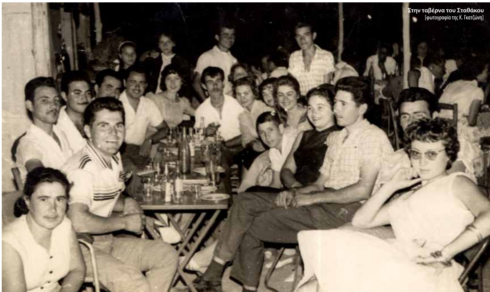
Στην ταβέρνα του Σταθάκου