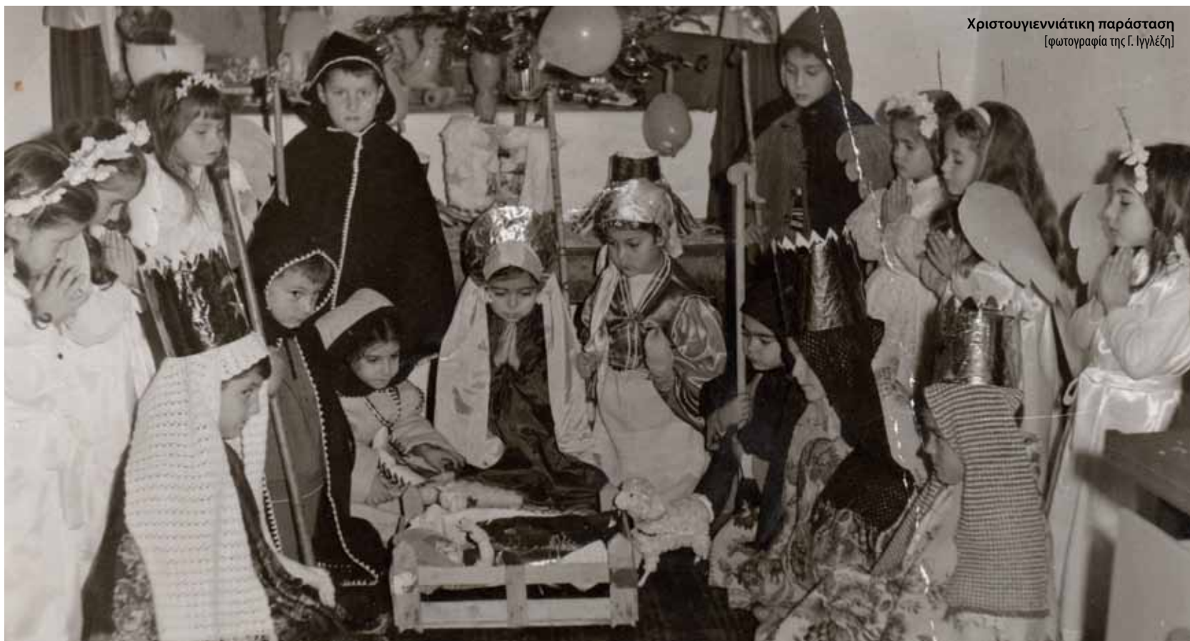
Χριστουγεννιάτικη παράσταση