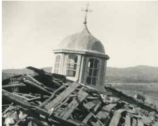
Τα ερείπια της εκκλησίας με τον τρούλο της αμέσως μετά τον σεισμό του 1932