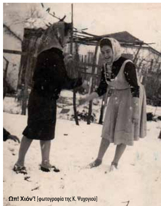
Ωπ! Χιόν!