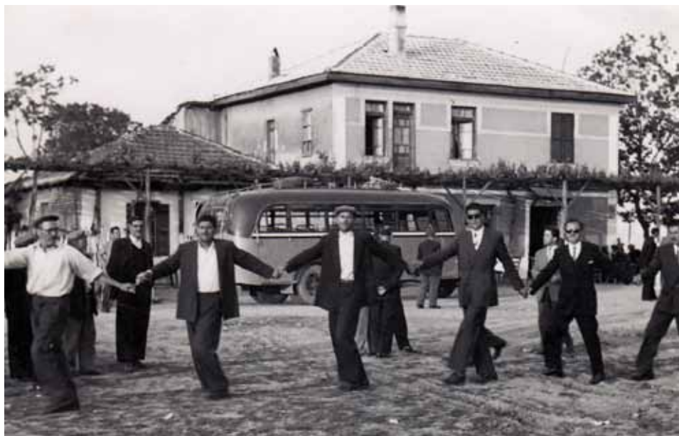
1970, Χορός στην παλιά στάση του λεωφορείου