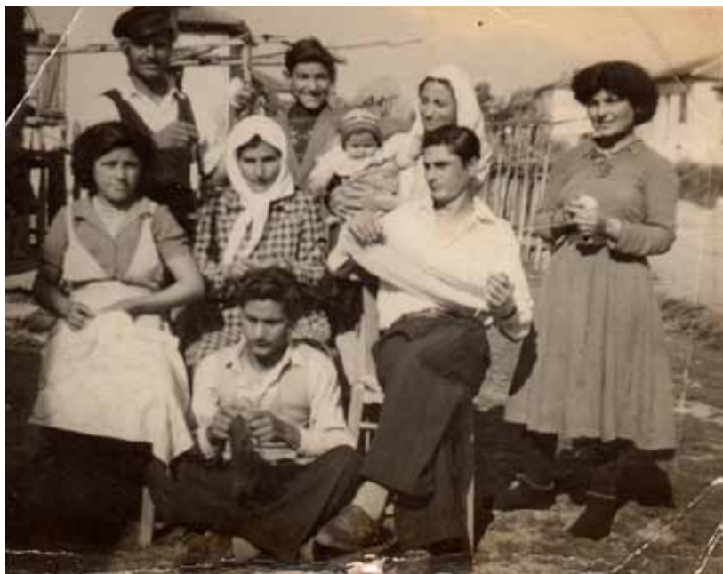
Ράβε ξήλωνε...