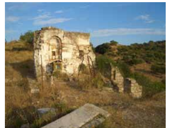
Τα απομεινάρια της εκκλησίας σήμερα

Εμένα μου άρεσε να ανεβαίνω στον γυναικωνίτη. Είχε ξύλινο πάτωμα και γύρω στασίδια. Είχε κι εδω εικονοστάσι για αυτές που ανέβαιναν. Σ' αυτό υπήρχε μία εικόνα της Παναγίας με το Χριστό, που ήταν η αγαπημένη μου. Ήταν περίπου 40 επί 50 εκατοστά και μέσα από το τζάμι της στο κάτω μέρος και σε σχήμα ημικυκλικό, σαν ν' αγκάλιαζαν την Παναγία, υπήρχαν κάτι πανέμορφα τριανταφυλλάκια. Δεν ξέρω από τι υλικό ήταν φτιαγμένα αλλά η ομορφιά αυτής της εικόνας με μαγνητίζε. Στεκόμουν και την κοιτούσα με τα παιδικά μου μάτια γεμάτα πίστη και θαυμασμό.