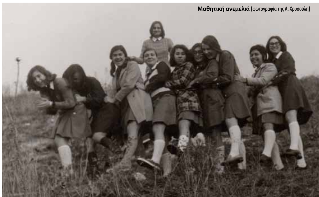
Μαθητική ανεμελιά [φωτογραφία της Α. Χρυσούλη]