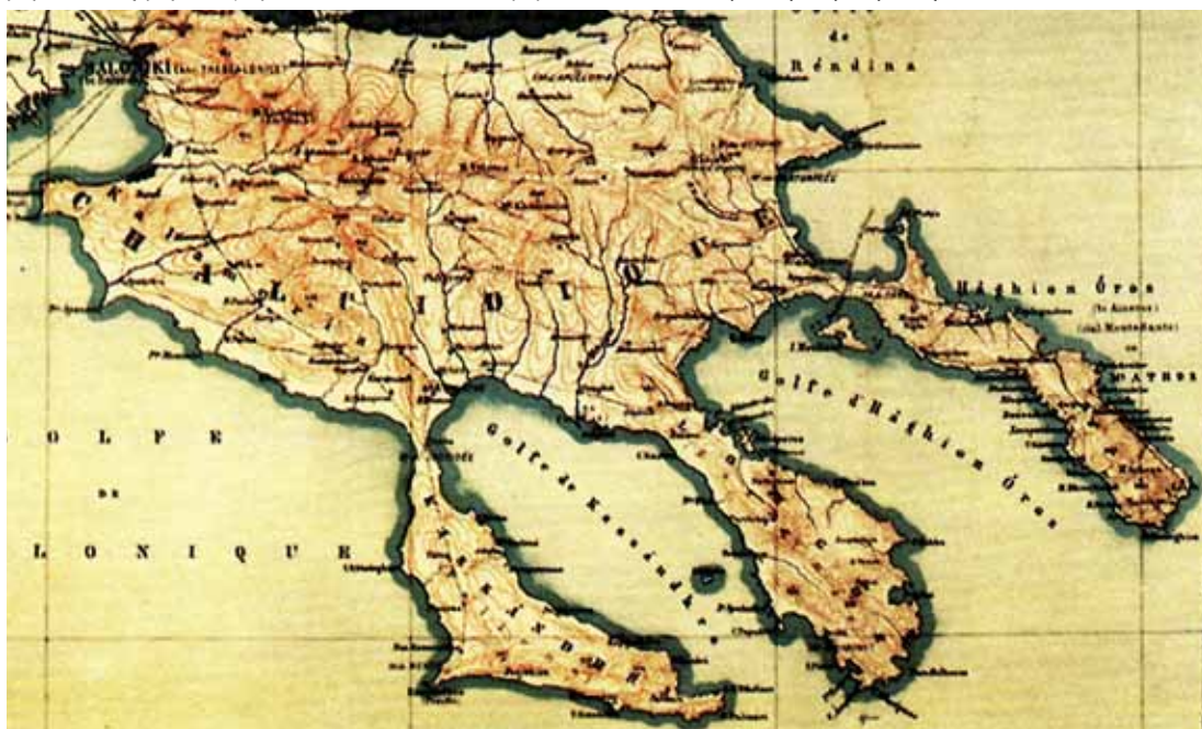
Ο χάρτης του Η. Kierpert που συμβουλευτήκε ο περιηγητής μας το 1861.

Όπως η Ιερισσός και όλα τα υπόλοιπα χωριά >>